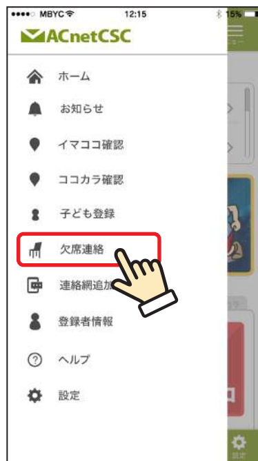
② 「欠席連絡」をタップします