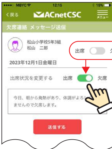
④ ラジオボタンを「欠席」にして、メッセージを入力後、「送信する」をタップしてください