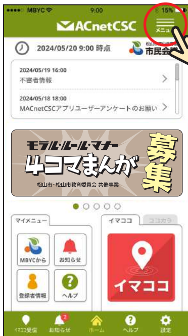
① アプリトップ右上の「メニュー」をタップします