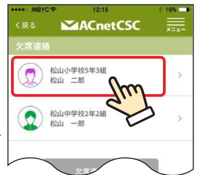
③ 連絡をしたい子どもさんをタップ